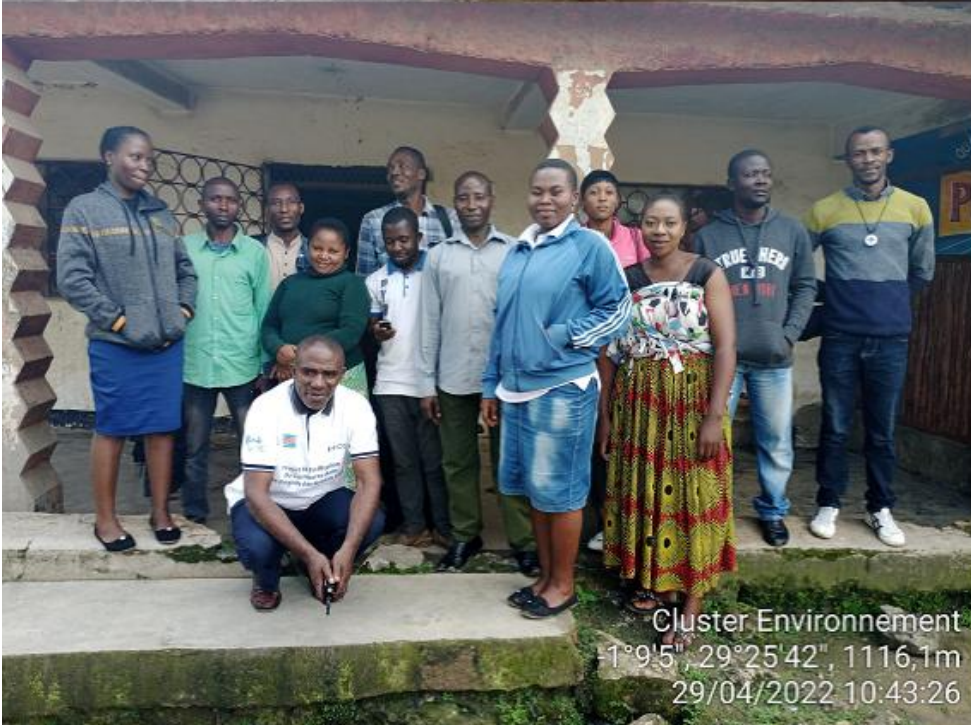
Cluster Environnement -1°9'5", 29°25'42", 1116,1m 29/04/2022 10:43:26