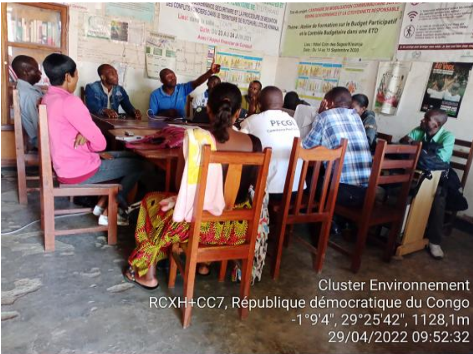
Cluster Environnement RCXH+CC7, République démocratique du Congo -1°9'4", 29°25'42", 1128,1m 29/04/2022 09:52:32